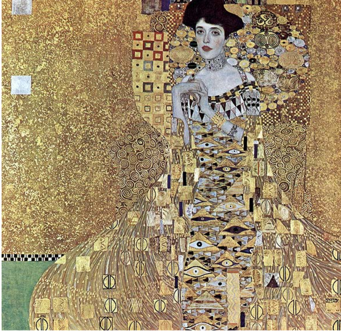
Adele Bloch-Bauer I, 1907

Önemli Yapıtları: Aşk Müzik I, Bir Kadının Portresi, Memorial Sanat Müzesi, Tıp, Yaşayan Su, Ölüm ve Yaşam, Adem ile Havva, Kadının Üç Çağı, Salome.