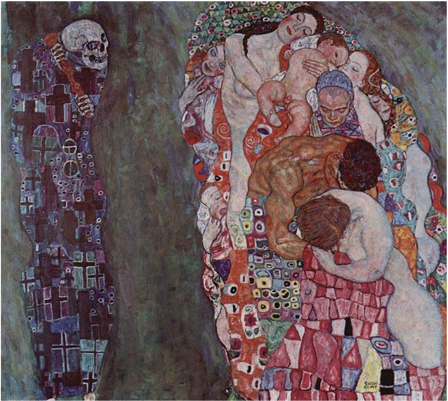
Yaşam ve Ölüm, 1908–1911