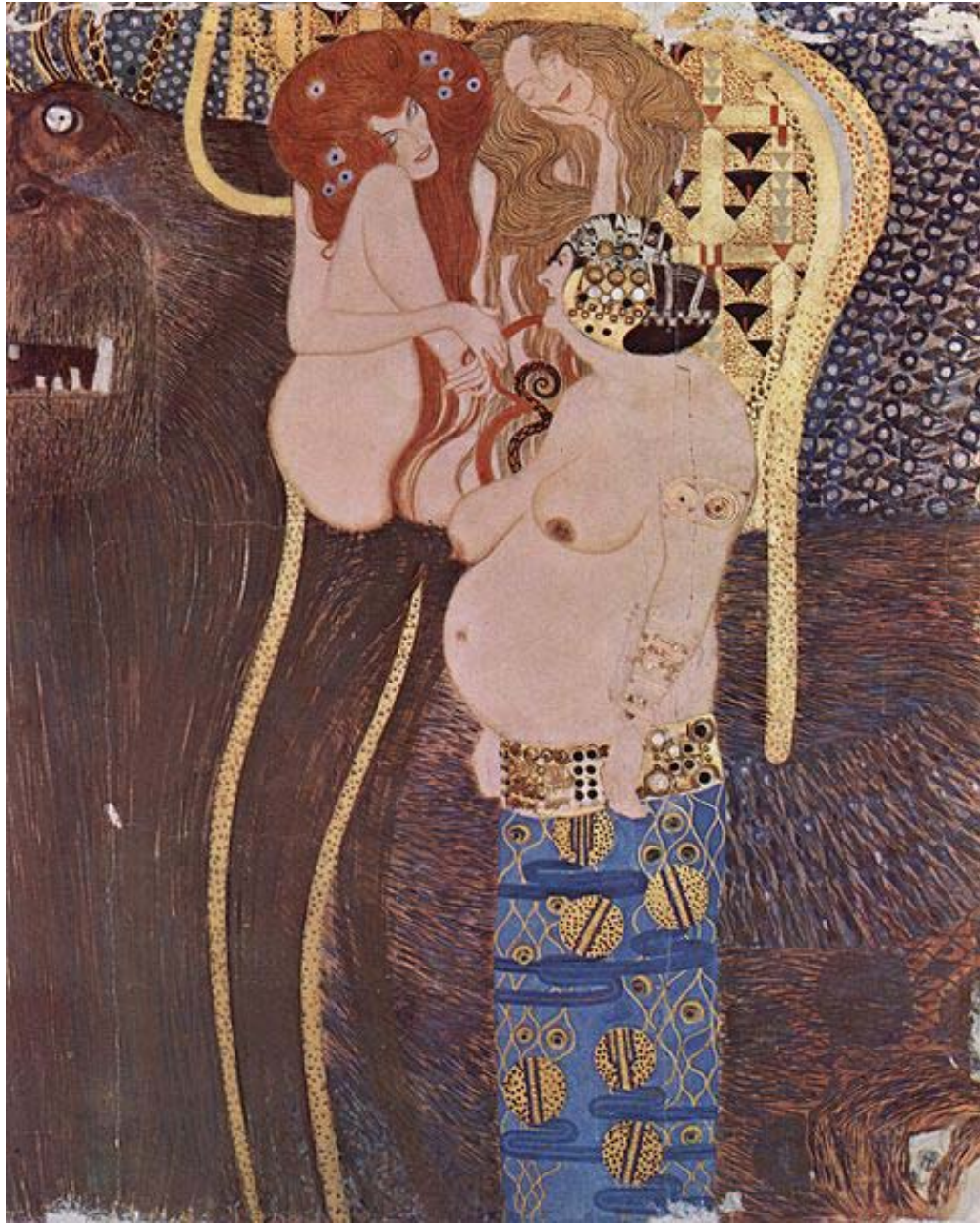
Beethoven Frizi'nden ayrıntı, 1902