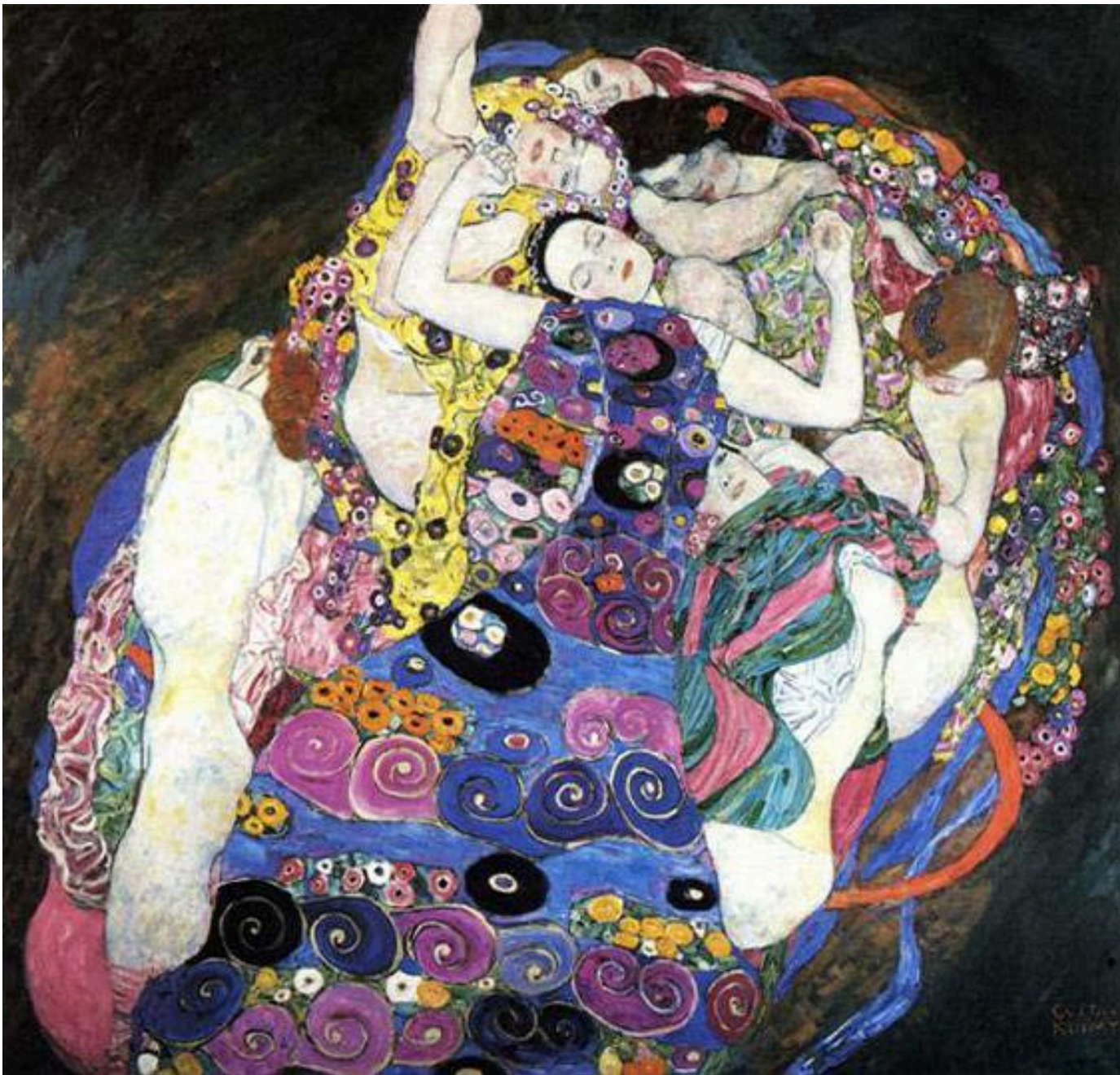
The Virgin, 1913, Oil on Canvas, 190x200 cm, Narodni Gallery, Prague, Czechia